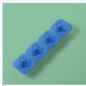
SFS-141 SB シリコン ハート型 260×65×25・20ml ¥1,200