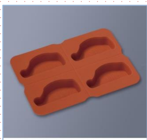
SFS-242 O 切り身魚型 270×195×23・70ml×4 ¥2,000