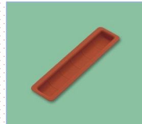
SFS-261 O シリコン かまぼこ型 255×63×20・120ml ¥1,200