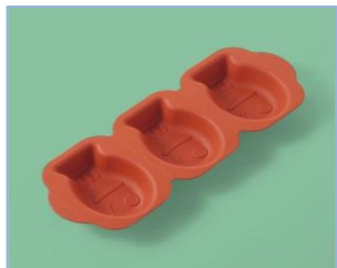
SFS-132 O シリコン 魚型 285×105×28・70ml ¥1,700