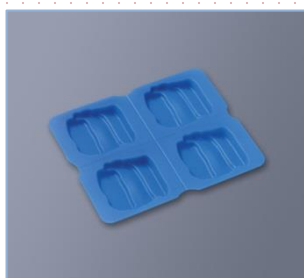
SFS-243 SB 焼肉型 233×198×18・60ml×4 ¥2,000