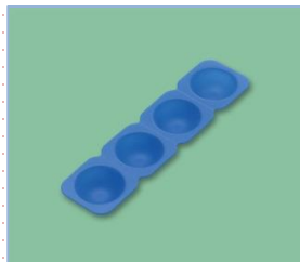
SFS-241 SB シリコン ドーム型 257×65×25・20ml×4 ¥1,200